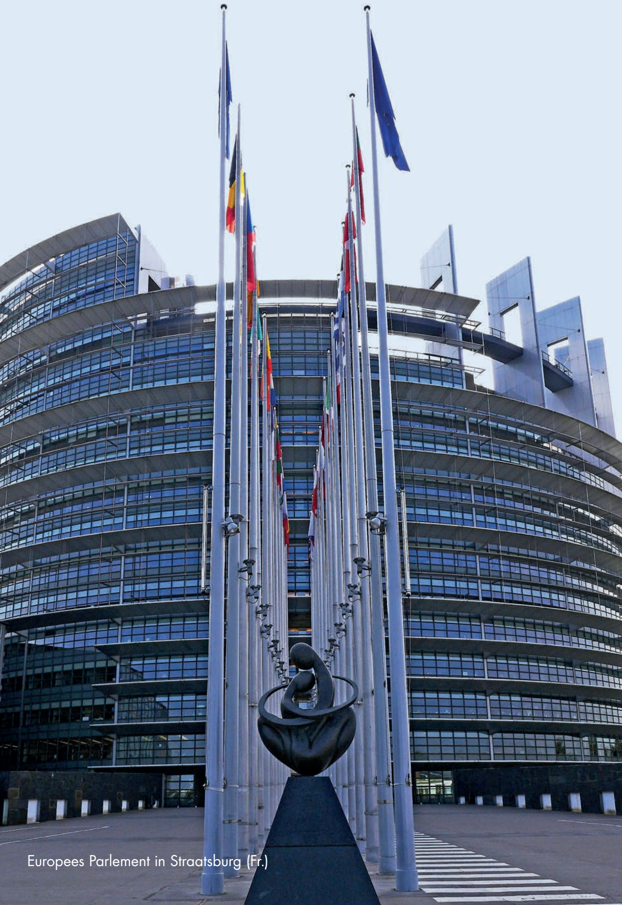
Europees Parlement in Straatsburg (Fr.)