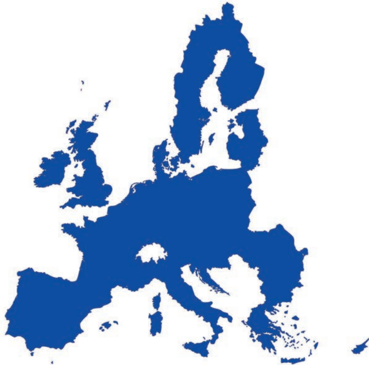
De Europese Unie (EU) in 1992

In 1999 werd er een begin gemaakt aan de gewenste monetaire unie, de euro werd het eindproduct van deze wens. Deze gemeenschappelijke munt zou een einde maken aan de verschillende valuta in Europa, waardoor er een nog grotere verbroedering zou ontstaan en het makkelijker zou worden om tussen de lidstaten te bewegen. Aan-