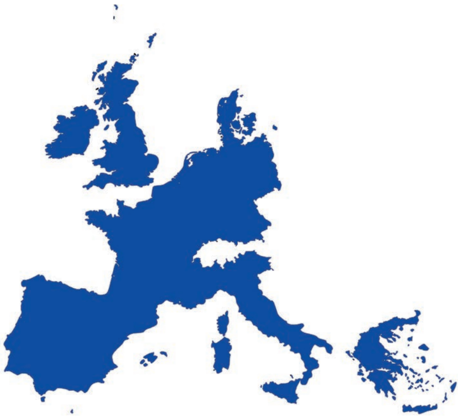
De Europese Economische Gemeenschap (EEG) in 1958

Het was tijd voor fase 4 van het Schumanplan: het integreren van de sociale, culturele en politieke sectoren.