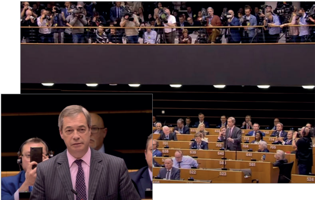
De laatste speech van Nigel Farage in het Europees Parlement voordat de Britten letterlijk opstapten: de Brexit was een feit.