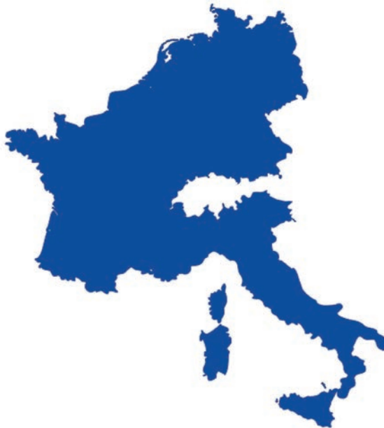
Europese Gemeenschap voor Kolen en Staal (EGKS) in 1952

De Raad was alleen maar een adviserend orgaan binnen de EGKS, echter was er wel goedkeuring van de Raad nodig om politieke beslissingen te nemen over zaken die niet over kolen en staal gingen. Deze zaken werden door de Hoge Autoriteit uitgewerkt en voorgesteld, de Raad mocht niets wijzigen of zelf indienen en dus alleen maar goed- of afkeuren.